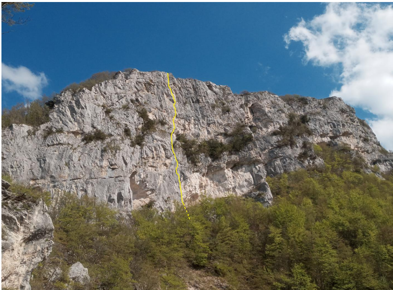
In GIALLO il tracciato di "NIDO DI RONDINE" e la parete ovest dell'Infernaccio